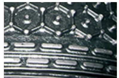
Vuilkeringen aan de achterzijde