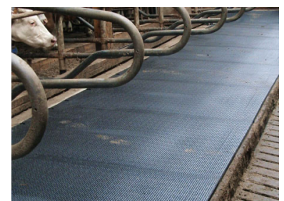
KKM LongLine in de praktijk