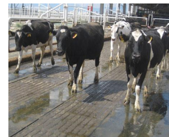
KURA CowWalk voor lange looppaden