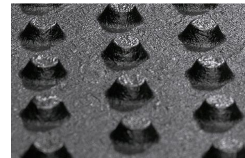
noppenprofiel voor ideale zachtheid