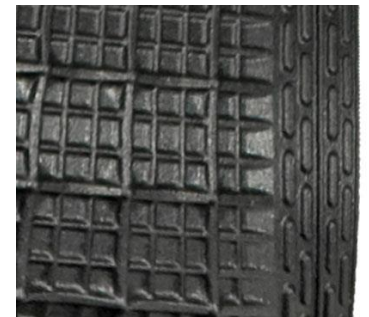
afdichtlippen aan de onderzijde