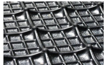
soepel Luchtkussen profiel